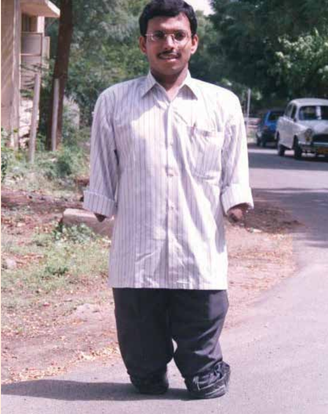
രാജാ മഹേന്ദ്ര പ്രതാപ്

അവർ ഉടൻ തയ്യാറായി. ഉയർന്ന വോൾട്ടേജോടെ വൈദ്യുതി പ്രവഹിക്കുന്ന കമ്പി തൊടാൻ. വൈദ്യുതി പ്രവഹിക്കുന്ന കമ്പിയിൽ കയ