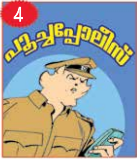
അജി മേലേടത്ത് നൗഷാദ് വെള്ളലശ്ശേരി