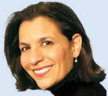
നോവലിസ്റ്റ്: ആർ.ജെ പലാഷിയോ

'ഓഗി' എന്ന് ചെല്ലപ്പേരുള്ള ഓഗസ്റ്റ് പുൾമാൻ എന്ന ബാലനാണ് ഈ നോവലിലെ കേന്ദ്രകഥാപാത്രം. 'ട്രീച്ചർ കോളിൻസ് സിൻ