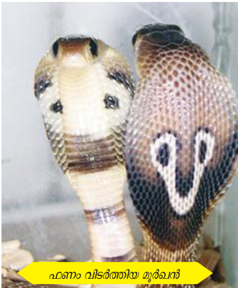
ഫണം വിടർത്തിയ മുർഖൻ

ഈ കാലത്ത് ഇവയെ പ്രകൃതിയുടെ ഭാഗമായി നിലനിർത്താനുള്ള ശ്രമങ്ങൾ ഏറെയാണ്. പാമ്പുകളെ പറ്റി കൂടുതൽ അറിയാനും പഠിക്കാനും വിവരങ്ങൾ ശേഖരിക്കാനും കൂട്ടുകാർ ശ്രമിക്കുമല്ലോ അല്ലേ..