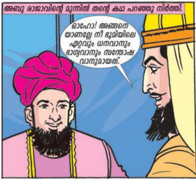
അബൂ രാജാവിന്റെ മുന്നിൽ തന്റെ കഥ പറഞ്ഞു നിർത്തി.

ഓഹോ! അങ്ങനെ യാണല്ലേ നീ ഭൂമിയിലെ ഏറ്റവും ധനവാനും ഭാഗ്യവാനും സന്തോഷ വാനുമായത്.