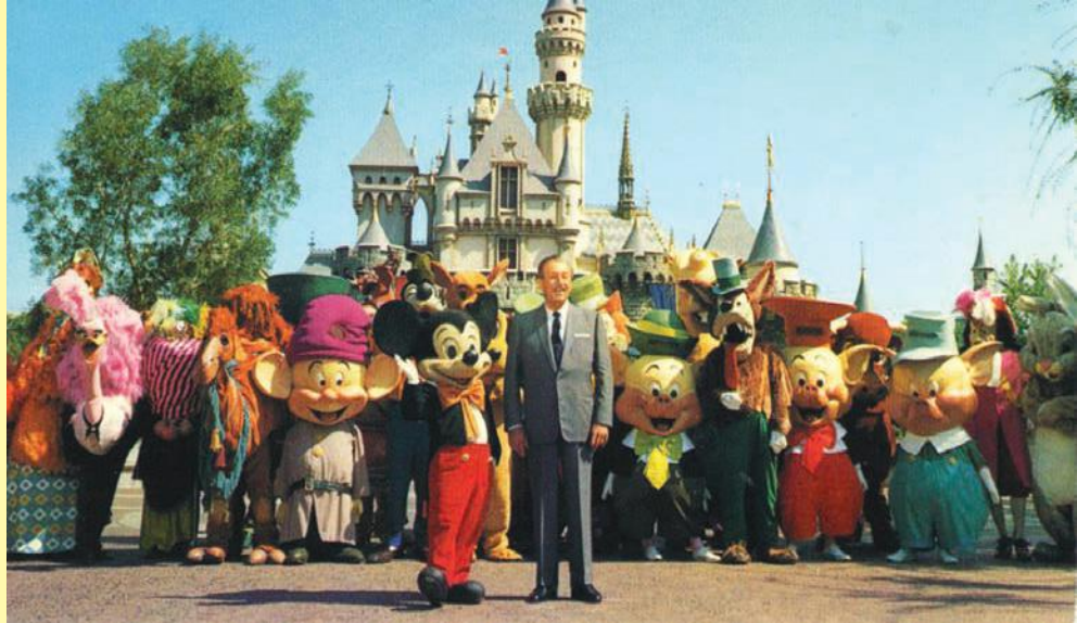
വാൾട്ട് ഡിസ്നി കാലിഫോർണിയയിലെ ഡിസ്നി ലാൻഡിനു മുമ്പിൽ

27,258 ഏക്കറിലായി പരന്നു കിടക്കുന്ന വാൾട്ട് ഡിസ്നി വേൾഡിൽ നാല് തീം പാർക്കുകൾ, 2 വാട്ടർ പാർക്കുകൾ, 27 തീംഡ് റിസോർട്ട് ഹോട്ടലുകൾക്കു പുറമെ ധാരാളം ഗോൾഫ് കോഴ്സുകളും ക്യാമ്പിങ്ങ് റിസോർട്ട്, ഔട്ട് ഡോർ ഷോപ്പിംഗ് സെന്ററായ ഡിസ്നി സ്പ്രിംഗ്സ് എന്നിവയുമുണ്ട്. ഇവിടം സർഗ്ഗത്യലുമാക്കുവാനായി 62,000 ജീവനക്കാർ രാപ്പകൽ അധാനിക്കുന്നു. അവധിക്കാലം ആഘോഷിക്കുവാനായി ഏറ്റവുമധികം സഞ്ചാരികൾ വന്നെത്തുന്നത് വാൾട്ട് ഡിസ്നി വേൾഡിലാണ്. പ്രതിവർഷം ശരാശരി 52 ദശലക്ഷത്തിലധികം വിനോദ സഞ്ചാരികളാണ് ഇവിടെ എത്തിച്ചേരുന്നത്.