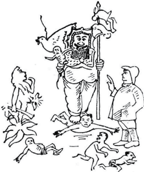
മലയാളത്തിലെ ആദ്യത്തെ കാർട്ടൂൺ ചിത്രം 1919 മാസിക - വിദ്യാഭരൻ