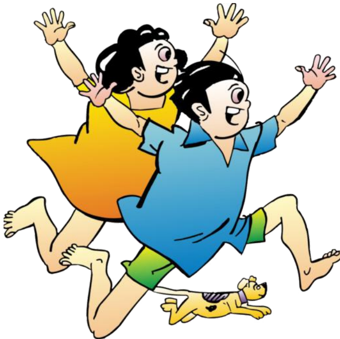
ബോബനും മോളിയും ടോംസിന്റെ മലയാളി യുടെ മനംകവർന്ന കാർട്ടൂൺ കഥാപാത്രങ്ങൾ

കൾ ചേർത്തുവെച്ച് അതിന് രസകരമായ കമന്റുകൾ ചേർത്ത് വെച്ചാണ് ആദ്യകാല കാർട്ടൂണുകൾ ഉണ്ടായതെന്ന് പറയപ്പെടുന്നു. യുദ്ധകാർട്ടൂണുകളിലൂടെ പ്രശസ്തി നേടിയ ഡേവിഡ് ലോ ഇരുപതാം നൂറ്റാ