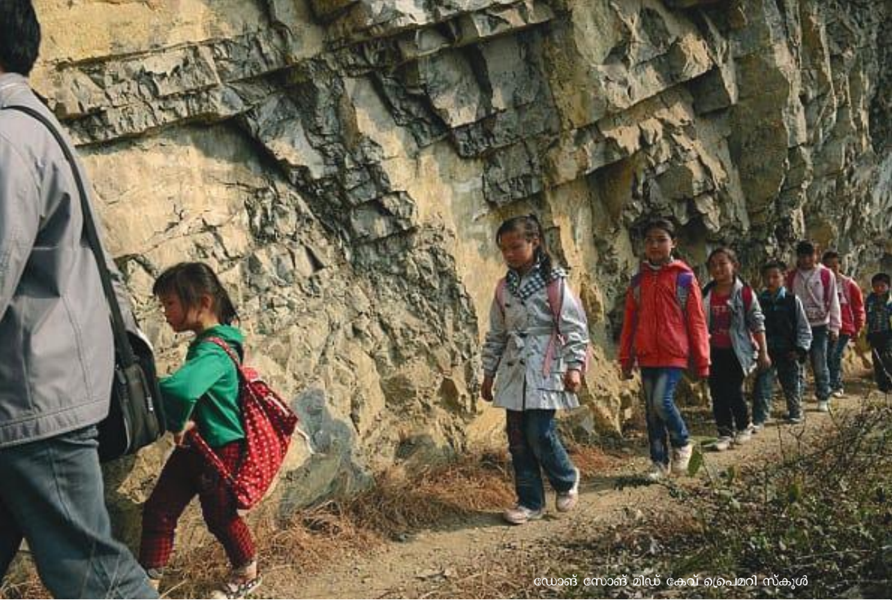
ഡോൺ സോൺ മിഡ് കേവ് പ്രൈമറി സ്കൂൾ

രാജ്യത്തെ എൻ.ജി.ഒ ആയ ശിശുലായി സ്വനി വർ സംഘസ്തയുടെ നേതൃത്വത്തിൽ 2002-ൽ നിരവധി ഭവനങ്ങൾക്കും ആരോഗ്യ കേന്ദ്രങ്ങൾക്കുമൊപ്പം 100 ബോട്ടുകളിൽ സ്കൂളുകളും മാറാൻ ഉണ്ടായി. സോളാർ വൈദ്യുതിയിലാണ് സ്കൂളിന്റെ പ്രവർത്തനം. ലാപ്ടോപ്പും ഇന്റർനെറ്റും മനോഹരമായൊരു ലൈബ്രറിയും അവിടങ്ങളിൽ സജ്ജീകരിച്ചിട്ടുണ്ട്. ഇതുവരെയായി 70,000 കുട്ടികളാണ് ഇതിന്റെ ഉപഭോഗം കൈമാറ്റം ചെയ്തത്.