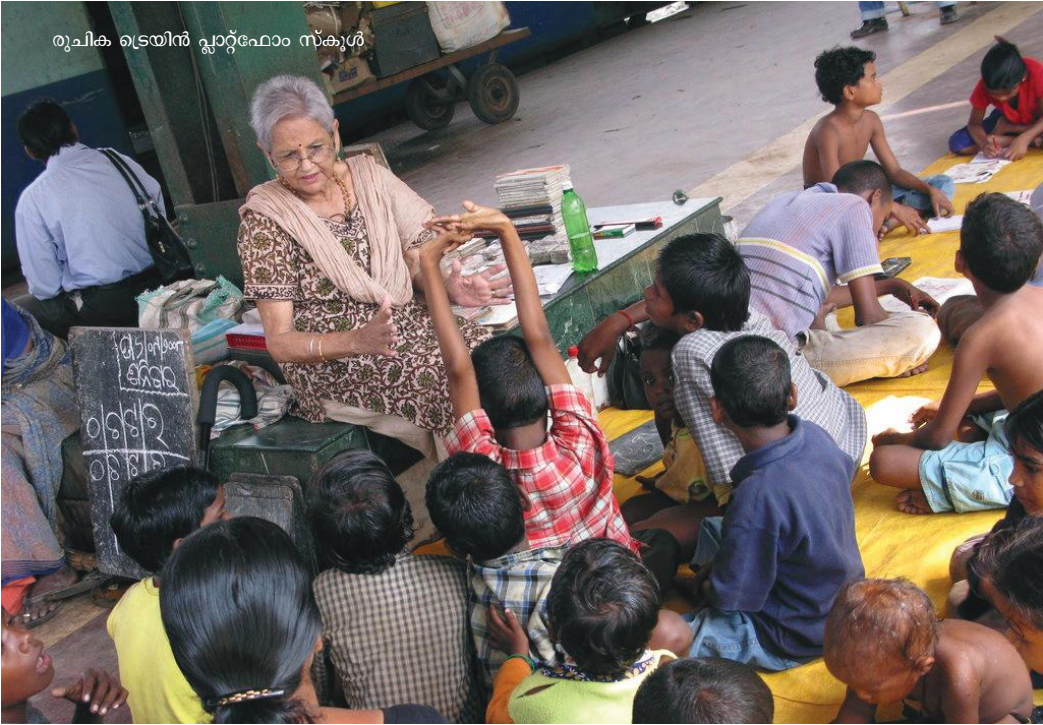
തുചിക ട്രെയിൻ പ്ലാറ്റ്ഫോം സ്കൂൾ