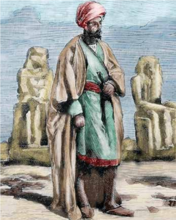
മുഹമ്മദ് ബിൻ തുഗ്ലക്ക്

മുഹമ്മദ് തുഗ്ലക്ക് പിന്നെയും പരിഷ്കരണങ്ങൾ നടത്തിക്കൊണ്ടിരുന്നു. പ്രജകളുടെ നന്മ മാത്രം മുന്നിൽ കണ്ട് തുടങ്ങിവെച്ച പല പ്രവർത്തനങ്ങളും വഴിയിൽ ഉപേക്ഷിക്കേണ്ടി വന്നു.