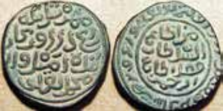
മുഹമ്മദ് ബിൻ തുഗ്ലക്കിന്റെ കാലത്തെ നാണയങ്ങൾ

തലസ്ഥാന മാറ്റം ദക്ഷിണേന്ത്യയിലെ സൂഫി ധാരയുടെ മുന്നേറ്റത്തെ ഒരു വോളം സ്വാധീനിച്ചിട്ടുണ്ട്. ഇസ്ലാമിക പ്രബോധന പ്രവർത്തനങ്ങൾക്കായുള്ള വലിയൊരു വഴി തുറക്കപ്പെടുകയായിരുന്നു പ്രസ്തുത മാറ്റത്തിലൂടെ ദർശകളും