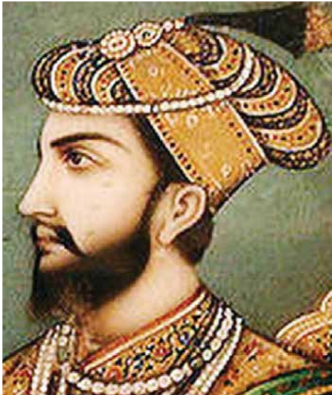
മുഹമ്മദ് ബിൻ തുഗ്ലക്ക്

ജൂനാആ ഖാൻ, ഉലൂഗ് ഖാൻ എന്നീ പേരുകളിൽ ചരിത്രത്തിൽ അറിയപ്പെട്ട വ്യക്തിയാണ് മുഹമ്മദ് ബിൻ തുഗ്ലക്ക്. ചരിത്രം വാനോളം പുകഴ്ത്തുകയും അത്ര തന്നെ ഇകഴ്ത്തുകയും ചെയ്ത ഇന്ത്യയിലെ മുസ്ലിം ഭരണാധികാരികളിലെ അപൂർവ്വ പ്രതിഭാ പുരുഷന്മാരിലൊരാൾ. അദ്ദേഹത്തിന്റെ പരിഷ്കാരത്തെപ്പറ്റി കേൾക്കാത്തവർ നമുക്കിടയിൽ കുറവാണ്. ഇന്ത്യ കണ്ട ഏറ്റവും മികച്ച പണ്ഡിതനും ബുദ്ധിമാനുമായ പരിഷ്കർത്താവിന് ചരിത്രം വിഡ്ഢി വേഷം ചാർത്തിയതിന്റെ കാരണം എന്തായിരുന്നു? 1326-ൽ മുഹമ്മദ് ബിൻ തുഗ്ലക്ക് ഡൽഹിയിൽ നിന്ന് തന്റെ തലസ്ഥാനം ഇന്നത്തെ മഹാരാഷ്ട്രയിൽ