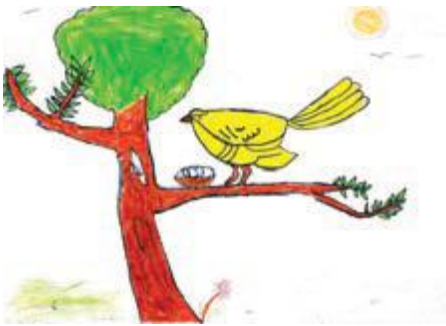
നിസവ മൈസൽ ക്ലാസ്- 5, ഫിനിക്സ് പബ്ലിക് സ്കൂൾ