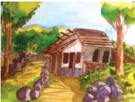
ചെസ ക്ലാസ്- 4, ഐഡിയൽ പബ്ലിക് സ്കൂൾ, കുറ്റ്യാടി