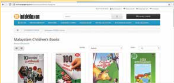
ഇന്റുലേഖ ഡോട്ട്കോമിന്റെ ഹോംപേജ്

പുസ്തകങ്ങൾക്കായി തുടങ്ങിയ ഒരു പോർട്ടലാണ് ഇന്റുലേഖ ഡോട്ട്കോം. ലിംകാ ബുക് ഓഫ് റെക്കോർഡ്സിൽ ഇടം നേടിയ പോർട്ടൽ കൂടിയാണ് ഇന്റുലേഖ. പുസ്തകങ്ങൾ കൂടാതെ സിനിമയെ കുറിച്ചും ഫാഷനെ കുറിച്ചും